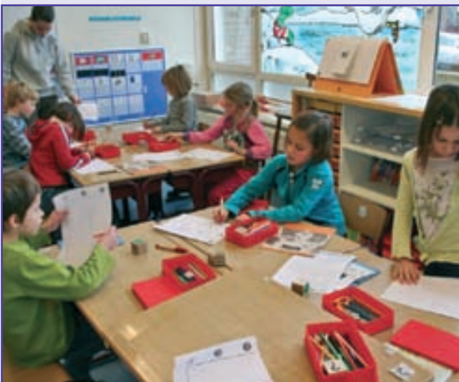
Boeiend in de klas

We hebben het tijdens de afgelopen maandelijkse bijeenkomsten o.a. gehad over mindmaps, gedragspatroongrafieken, relatiecirkels, breinvriendelijke klas en zorg en boeiend onderwijs. Wat daarnaast heel waardevol is om steeds helder te houden, is WAAROM we hiermee bezig zijn en het uitwisselen van ervaringen is ook heel belangrijk. Deze teamontmoetingen zijn steeds in een ander lokaal en beginnen met een MI-structuur, verzorgd door één van de leerkrachten.