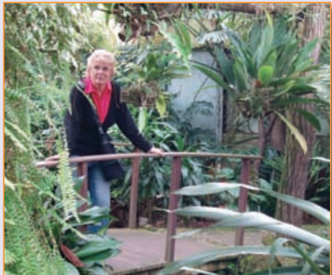
De Beatrix is mijn superplekkie!