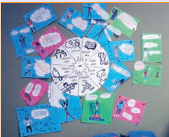
Iedere leerkracht doet 't op z'n eigen manier

foto's). We proberen de lessen zo op te bouwen dat er altijd een aantal intelligenties aan bod komen. Het is heel inspirerend om te zien hoe het nu in de school wordt opgepakt en hoe de lokalen er uit gaan zien. Want ook daar hebben we naar gekeken, is het lokaal een uitdagende leeromgeving voor het kind. We proberen meer te gaan werken met hoeken, al zijn onze lokalen daar niet helemaal op berekend. We blijven ons hierin ontwikkelen want het is goed om te zien waar een kind goed in is en waar het eventueel nog meer in ontwikkeld kan worden.