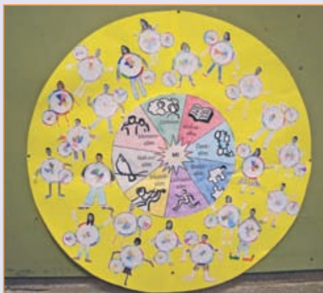
Op welke manier ben jij intelligent?

structuren zijn rondpraat en tweetal gesprek. In de afgelopen jaren zijn we die structuren steeds verder uit gaan bouwen en inmiddels hebben we een lijstje met structuren die door de hele school gebruikt worden. De leerlingen leren zo om met elkaar samen te werken, zelfstandig te werken, vragen te beantwoorden en iedereen moet over een vraag nadenken. Dus de leertijd is veel effectiever. En het maakt het onderwijs veel boeiender.