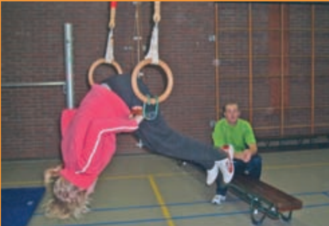
Borst-waartsom op de trapezestok

Valpartijen, geduw en getrek, krauwen en blauwe plekken horen hier gewoon bij. (Of is dit frustratie?) Al deze activiteiten bij elkaar zorgen wel voor spierpijn en stramme gewrichten. Gelukkig gaat dat over, maar de week daarop heb je het gewoon weer!